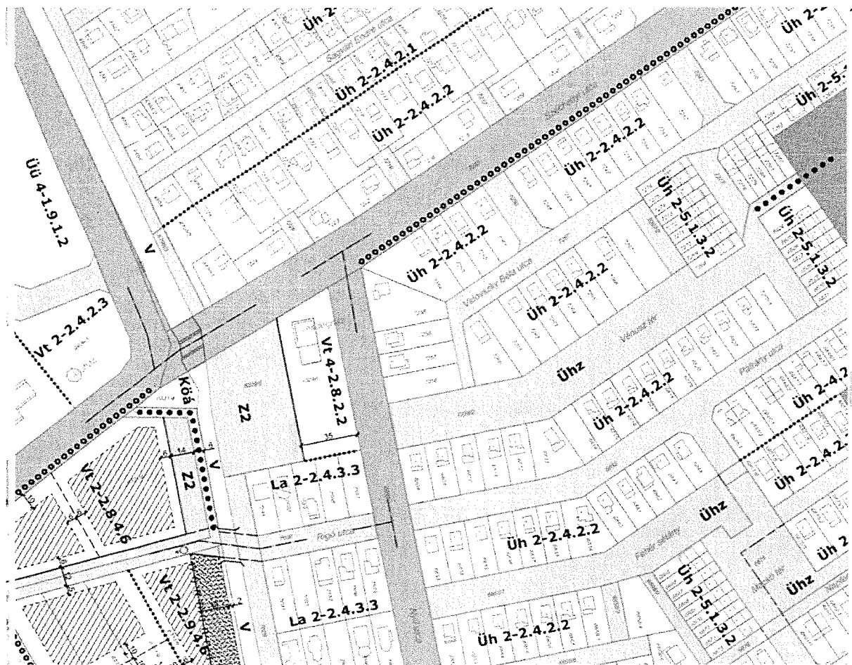
Hatályos Szabályozási Terv kivonata